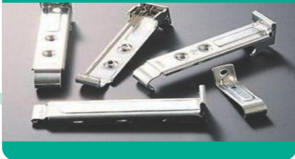
カーテンレール固定金具